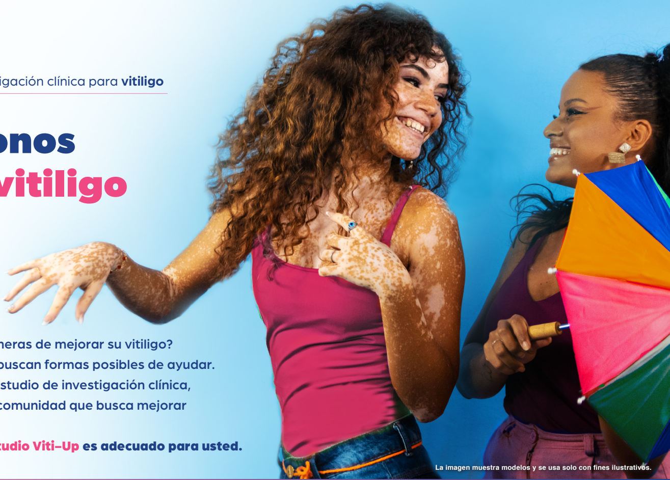
La imagen muestra modelos y se usa solo con fines ilustrativos.

¿Está buscando maneras de mejorar su vitiligo? Los investigadores buscan formas posibles de ayudar. Al participar en un estudio de investigación clínica, puede unirse a una comunidad que busca mejorar el futuro del vitiligo. Compruebe si el estudio Viti-Up es adecuado para usted.